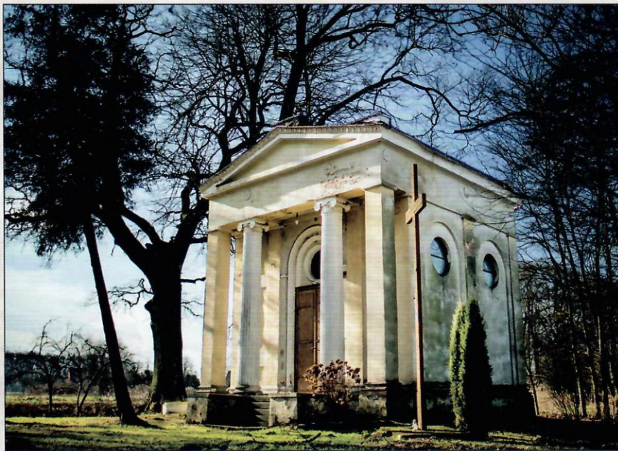
Kaplica w Rakowie przypomina antyczna świątynię i robi naprawdę duże wrażenie

Mijają wieki, lata, a każdy chciałby coś po sobie zostawić, aby nie zatarta się pamięć po nim. Zostawiamy wspomnienia pomniki, budowle ... Czy potrafimy to pielęgnować i dbać o to co inni stworzyli?